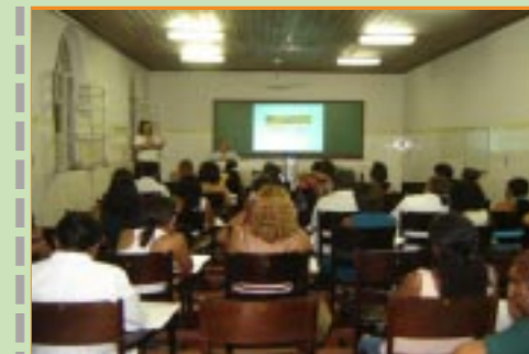
Uma das palestras do Coren-MAIS PERTO DE VOCÊ no auditório da Santa Casa de Misericórdia

Para solicitar a visita do Programa COREN-MAIS PERTO DE VOCÊ, no seu local de trabalho, basta que a Chefia de Enfermagem faça um pedido formal ao Conselho e o encontro será agendado.